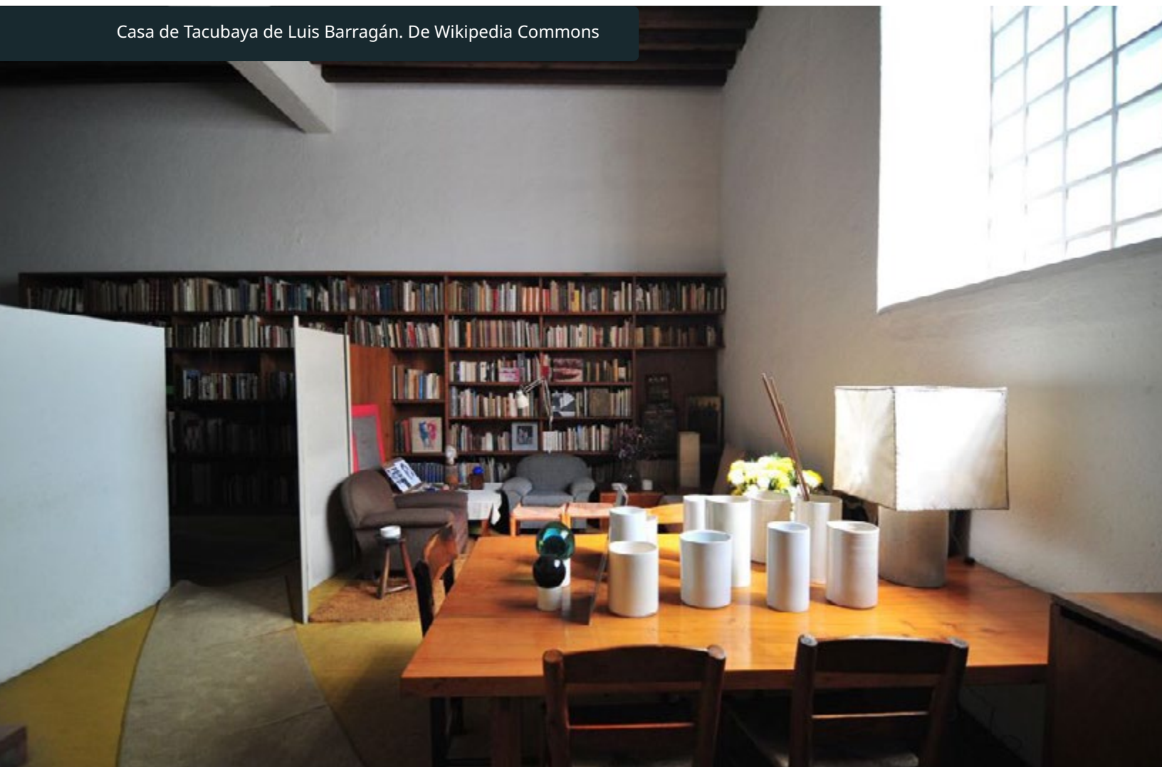
Casa de Tacubaya de Luis Barragán.