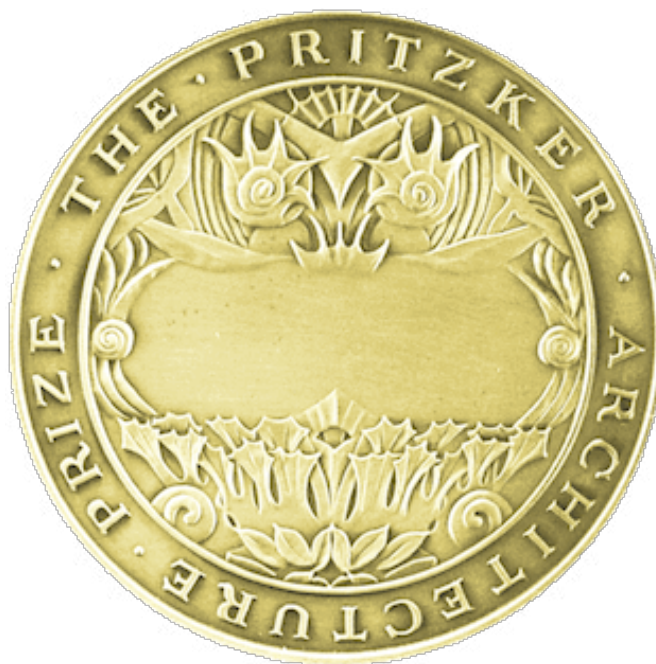
Premio Pritzker.

Cabe mencionar que el ingeniero civil tapatío Luis Barragán ganó el premio Pritzker en 1980; también que en 1991 se le otorgó a Robert Venturi y que se excluyó a su esposa Denisse Scott Brown,