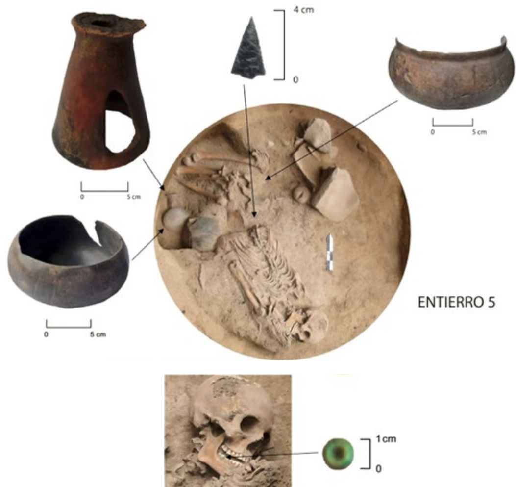
Imagen 1. Entierro del periodo Formativo, Proyecto Guadalupe Victoria, núm. 98, 2006, DSA-INAH.

Así, la arqueología estudia la relación que existe entre los artefactos, transportables y no transportables, y las conductas humanas, y no se restringe a una época en particular, sino que puede enfocarse en cualquier tiempo y lugar (Reid et al. , 1975); por ejemplo, estudia lo referente a los primeros pobladores del continente americano, las sociedades mesoamericanas, las épocas virreinal y moderna e, incluso, también puede analizar a la sociedad en la que nos