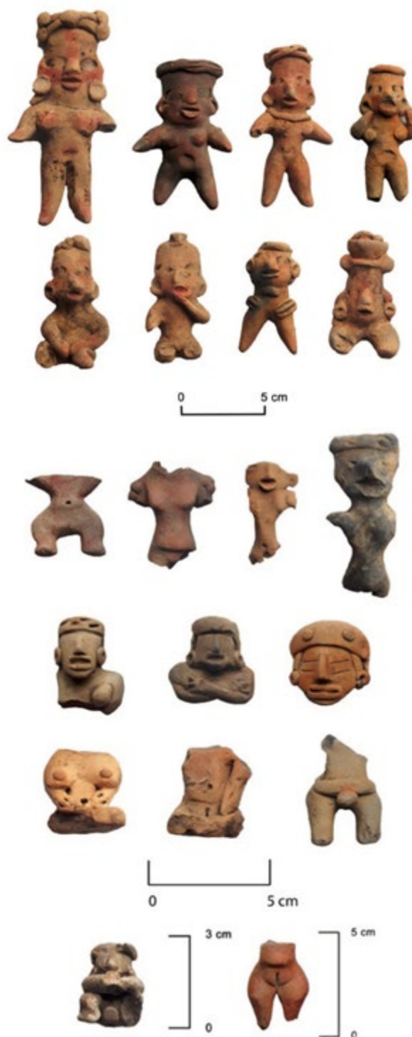
Imagen 2. Figurillas antropomorfas del periodo Formativo Medio y Formativo Tardío, Proyecto Guadalupe Victoria, núm. 98, 2006, DSA-INAH. Tomado de Meraz y Rivera, 2022.

Por otro lado, para proponer explicaciones e interpretaciones válidas, la arqueología se auxilia metodológicamente de trabajos experimentales, por ejemplo, para replicar la elaboración de ciertos artefactos o los efectos de una acción; de trabajos etnográficos que permiten identificar las conductas humanas que intervienen en alguna actividad (Schiffer, 2010); así como de fuentes históricas y etnohistóricas para contrastar con ellas los hallazgos; de esta forma, los investigadores pueden plantear hipótesis, así como realizar analogías respecto de las actividades y las conductas humanas, y todo ello se realiza enmarcado por referentes teóricos y conceptuales que sustentan la investigación.